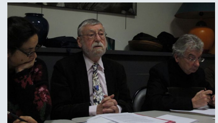
Le bureau de l'APCP lors de l'AG du 11 décembre.

A cet égard, la prise de position du Bureau national du Parti socialiste au printemps en faveur de cette création, l'acquiescement des autres formations politiques (constaté notamment lors du colloque du 13 juin à la Sorbonne), puis la décision prise par la ministre de la culture et de la communication en novembre de confier une mission d'expertise sur le sujet... autant d'avancées qui ont fait de 2013 une « année politique ».